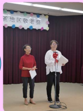
社協役員のにわか漫才