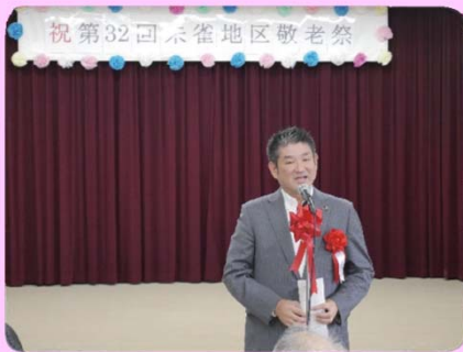
仲川市長のご挨拶

手作りの朱雀地区敬老祭は、お弁当とお飲物、民児協プレゼントのフルーツを準備して来年も実施いたします。参加費はもちろん無料です。どうぞお気兼ねなくみなさまご参加ください。